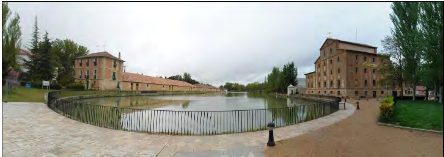
Dársena del Canal de Castilla en Medina de Rioseco.

En la mañana del domingo van a disfrutar de esta magnífica obra con un agradable paseo en barco con el que podrán ver desde dentro la gran obra de ingeniería que es el Canal de Castilla. Tomarán la embarcación en la dársena de Medina de Rioseco, que es a su vez una de las localidades castizas más bonitas gracias a sus construcciones religiosas.