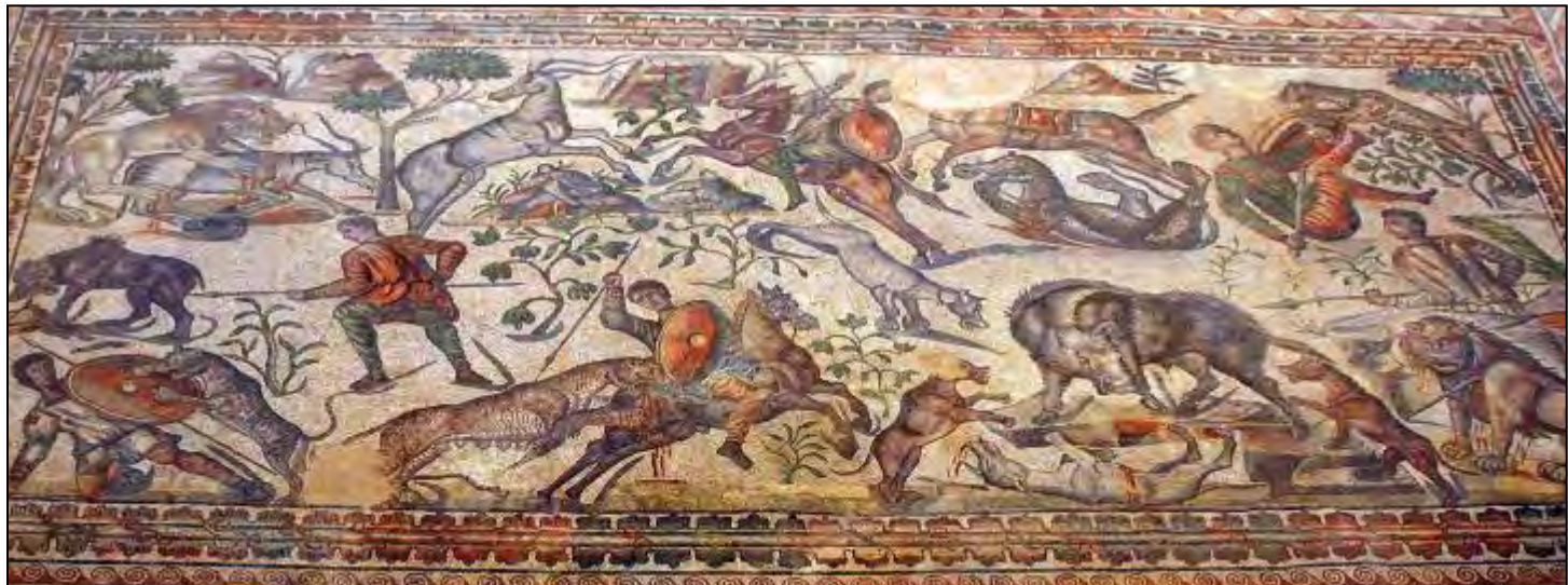
Mosaico de la Villa Romana La Olmeda.

La visitarán y podrán admirar los maravillosos capiteles historiados que decoran todas las columnas de las naves de la iglesia.