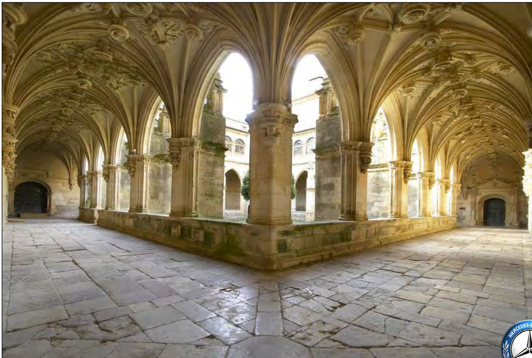
Claustro gótico del Real Monasterio de San Zoilo en Carrión de los Condes.