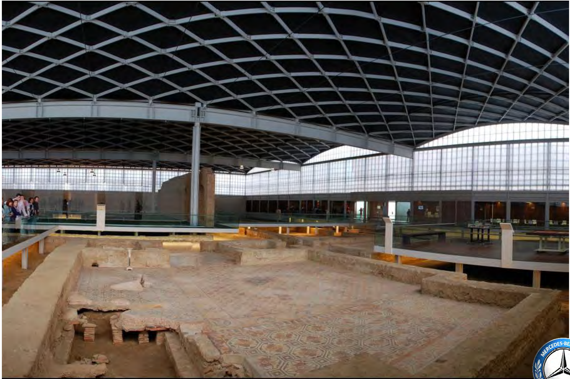
Villa Romana La Olmeda.